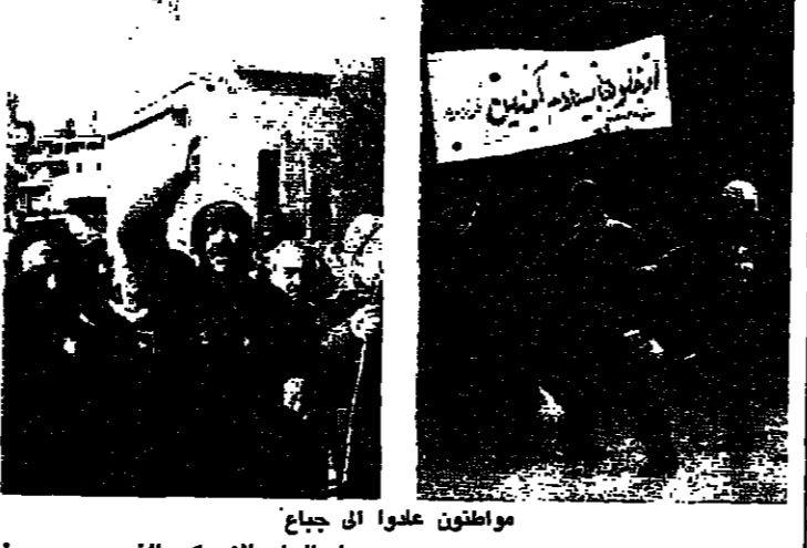
مواطنون علوا الى جبايع